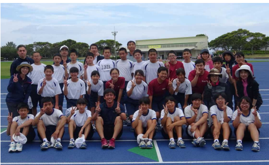
<大会終了後 いい笑顔です！>